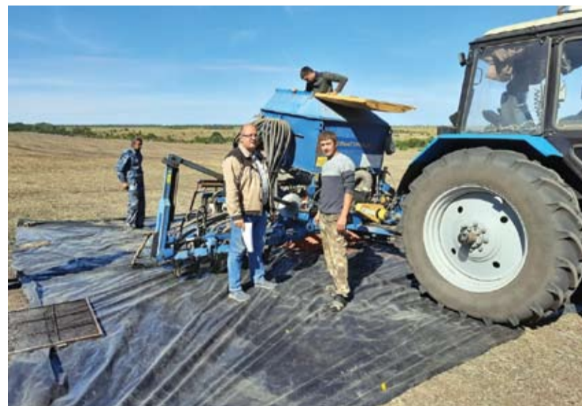
Зачистка сеялки перед закладкой опытных участков озимой пшеницы.

Нам удалось сформировать работоспособный и ответственный коллектив. Проводим постоянно обучение работников. Несмотря на то, что средний