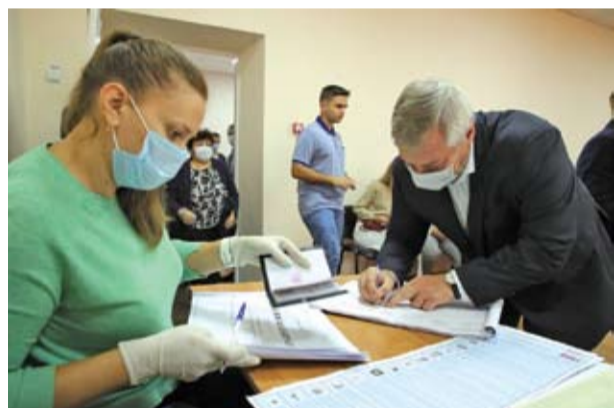
Выборы в Ростове-на-Дону.

В составе Госдумы РФ нового, восьмого созыва представлять Ростовскую область будут 13 депутатов. Столько же было и в седьмом созыве.