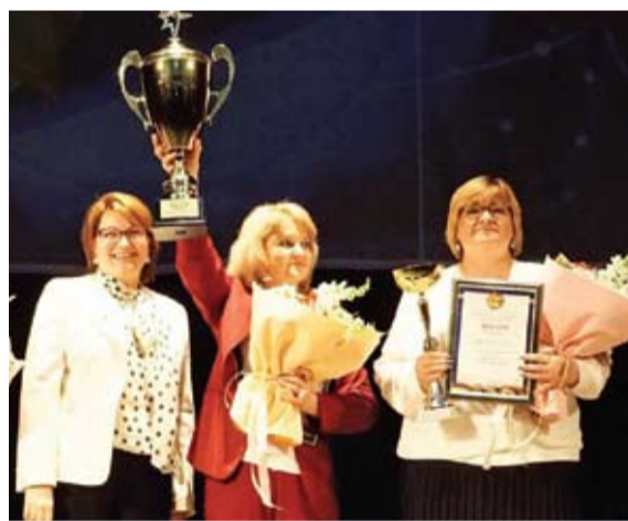
16-я школа – победитель Юнармейского марша

Людмила Корниенко, фото из архива предприятия